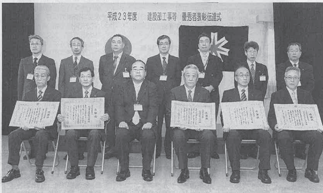
札幌建設管理部 委託部門で受賞した5社の代表が札幌建設管理部 幹部と記念撮影