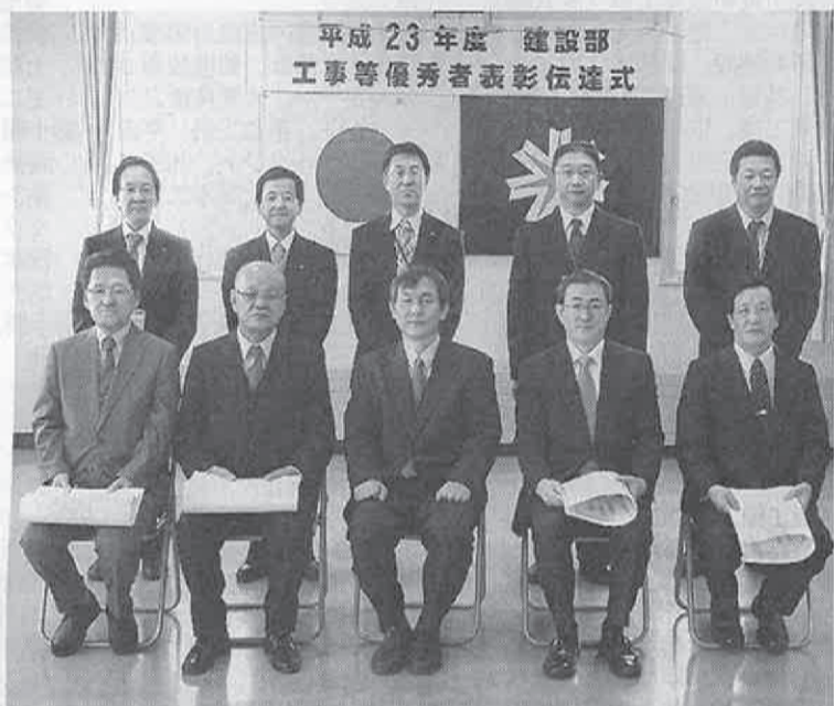
小樽建設管理部 後志管内からは一般土木4社が 栄誉に輝いた